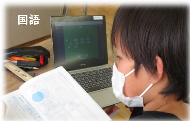
タブレットを使って学習中♪