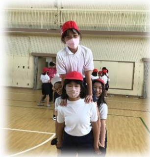
騎馬を組んでみたよ