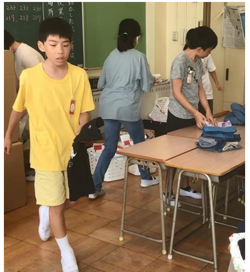
キッズの夏用に入れよう