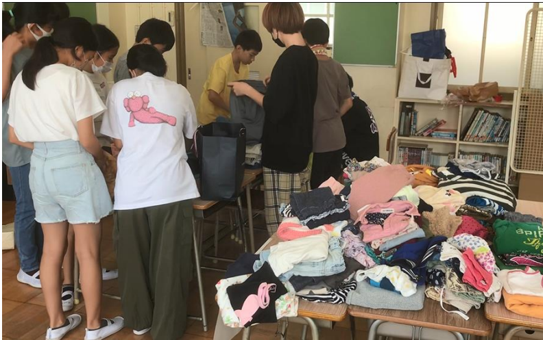
たくさん集まった服を仕分けします

「服のチカラプロジェクト」に、たくさんの服が集まりました。9月中に仕分け、箱詰めをし、10月初旬にユニクロ事業部に送ります。