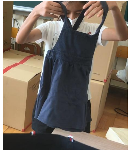
これはキッズかな ベビーかな