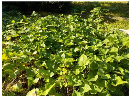
サツマイモの葉がいっぱいです。秋の芋掘りが楽しみです。