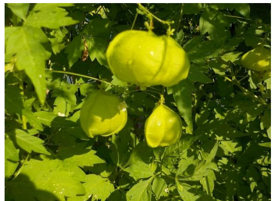
フウセンカズラの実は、ふうせんの形がかわいいね。