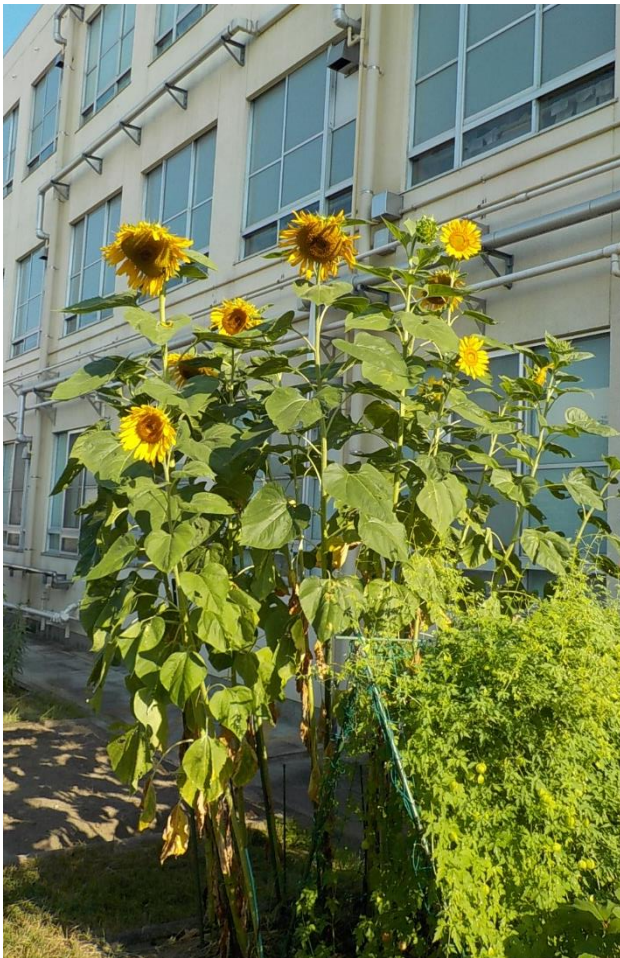
ヒマワリがこんなに大きくなりました。